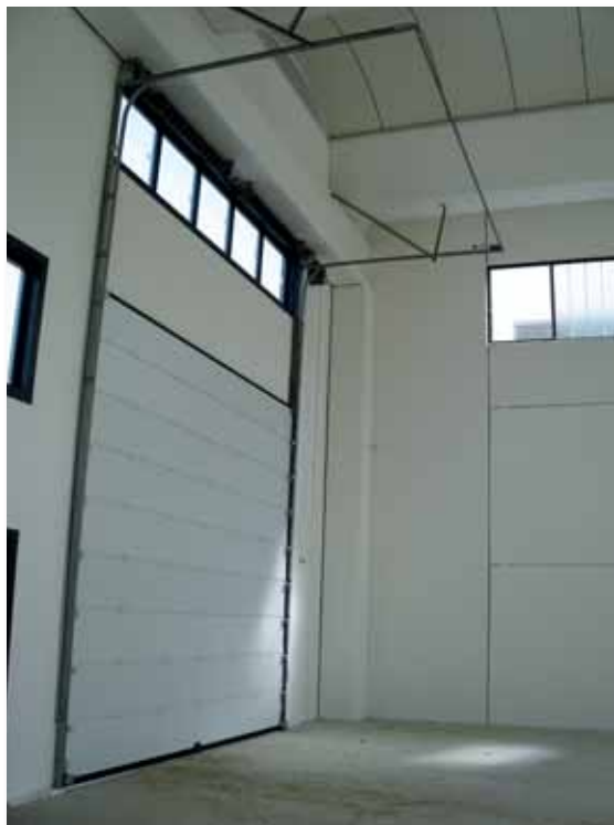
Porta sezionale parzialmente verticale con motore a palo serie LATO, vista interna