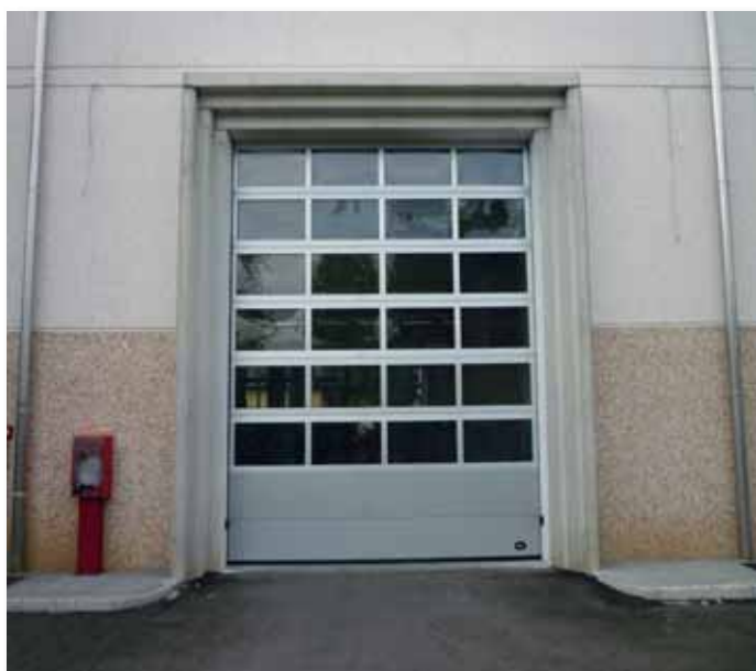
Sezionale mod. Panoramico