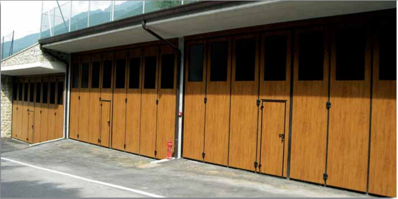
Portone a libro 4+4 - Tinta legno quercia chiaro con sezioni grigliate