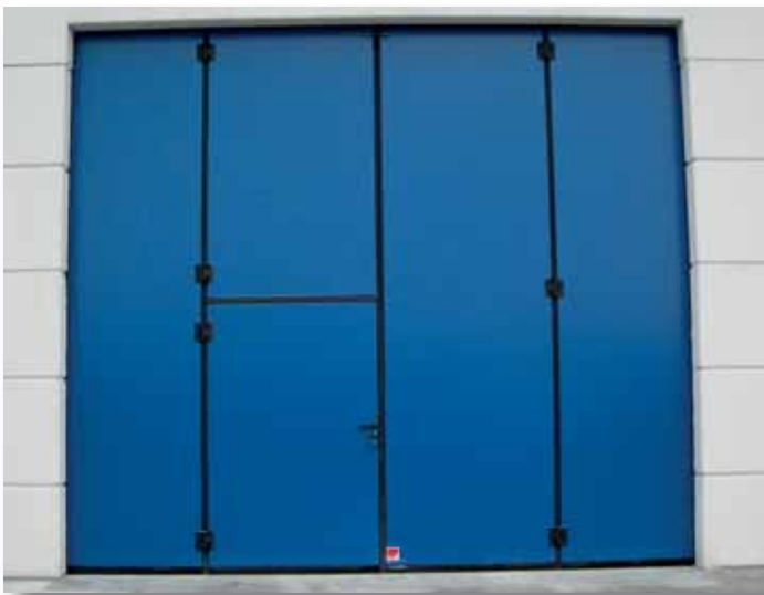
Portone a libro 2+2 - Colore Blu RAL 5010 con porta pedonale (anta tagliata) senza inciampo