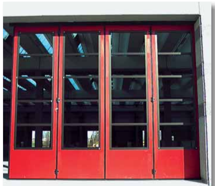
Portone a libro 4+0 - Colore Rosso RAL 300 con sezioni finestrate in alluminio