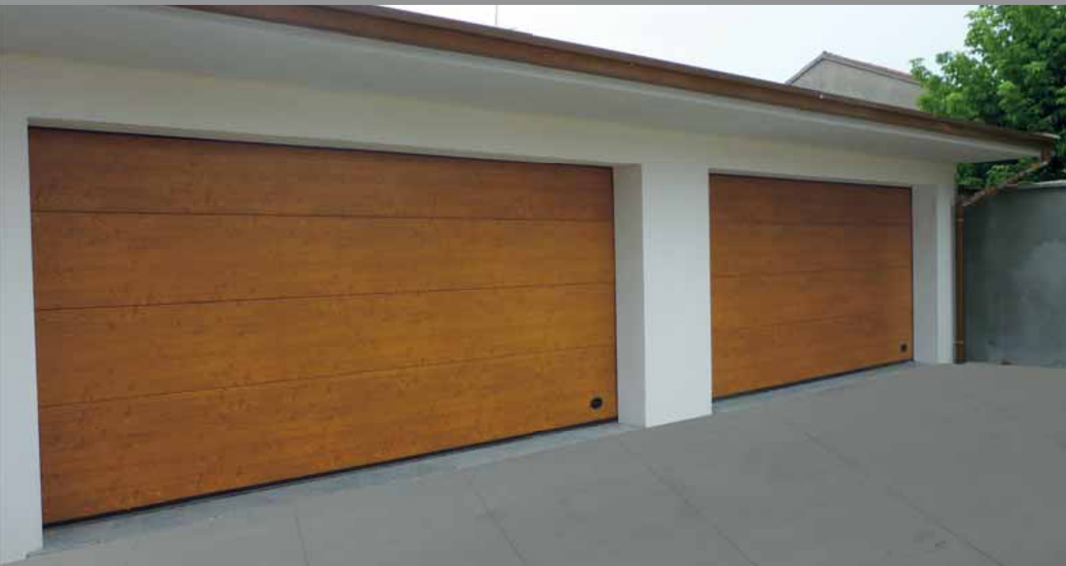
Amazonas simil legno rovere antico

Realizzata con pannelli coibentati in acciaio preverniciato con spessore 0,5 mm, rivestiti con una speciale pellicola in materiale plastico idonea per la collocazione esterna e atta a garantire la massima durata nel tempo, che riproduce fedelmente l'effetto del legno su una superficie liscia, senza richiederne la stessa manutenzione. Caratteristica distintiva è l'assenza di doghe e la finitura liscia del pannello, che mettono in luce l'eleganza della semplicità.