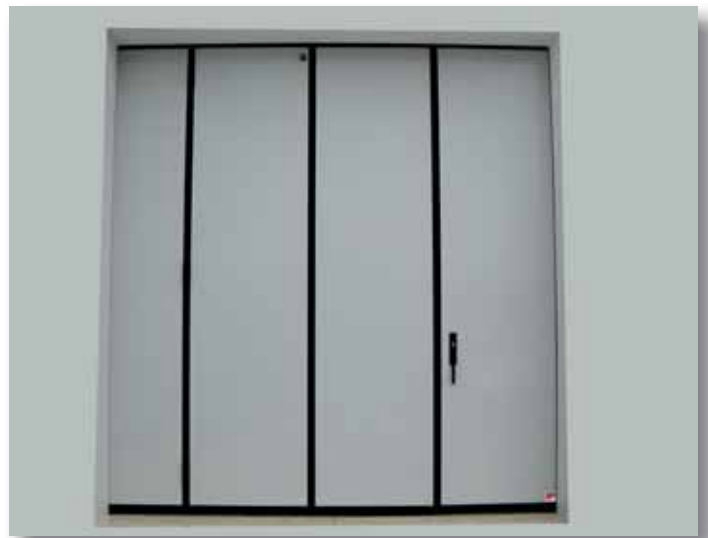
Portone a libro 3+1 - Colore Bianco Grigio RAL 9002 con serratura esterna