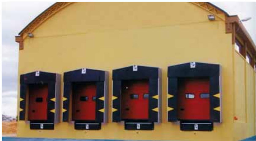
Sezionale - Portale isotermico - Pedana