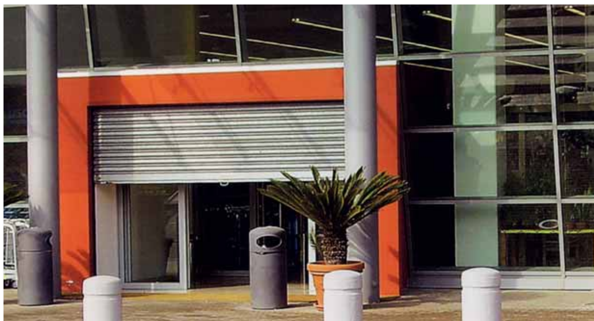
Serrande con molle a spirale