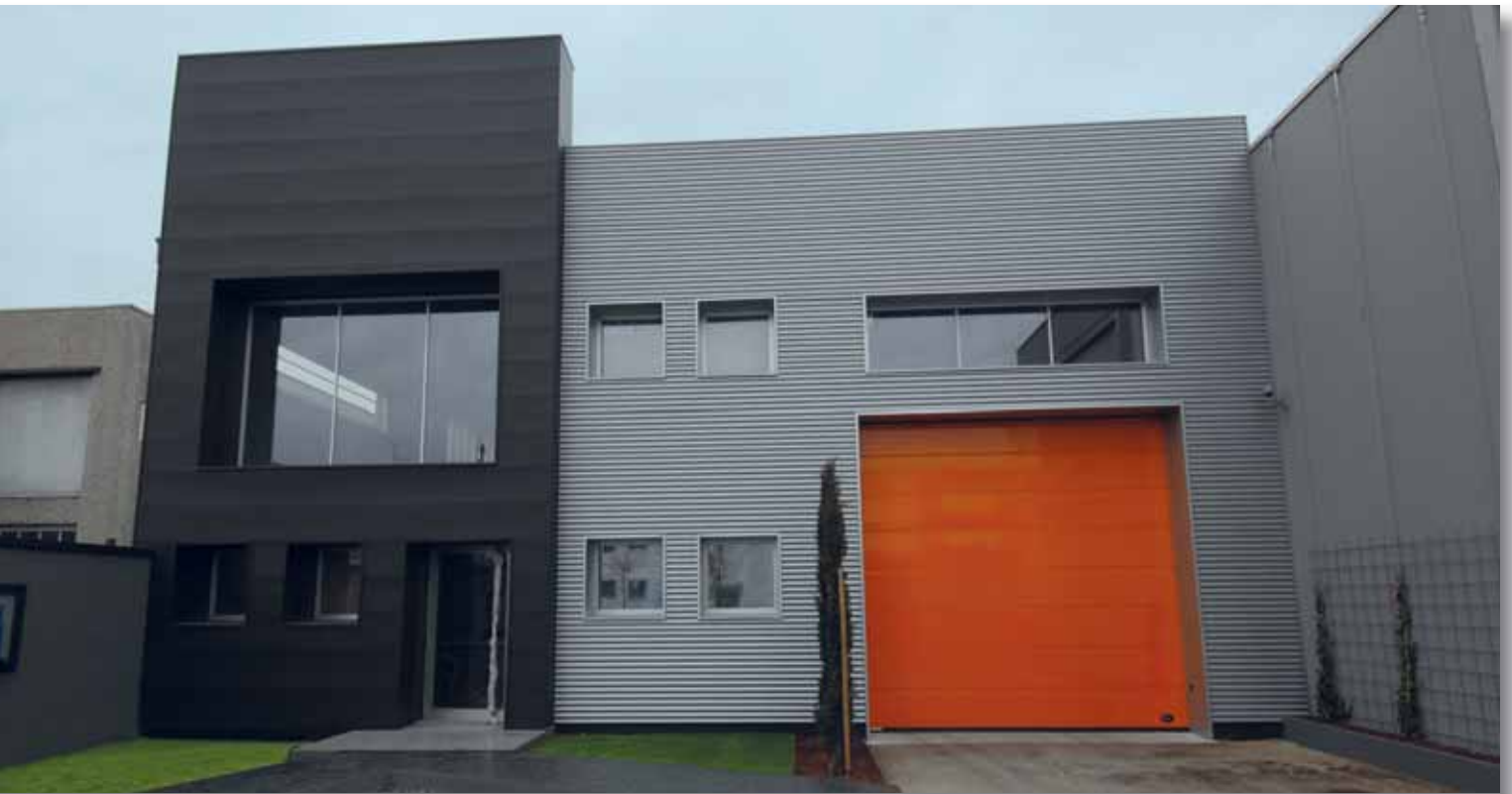
Portone sezionale con pannello verniciato in tinta RAL