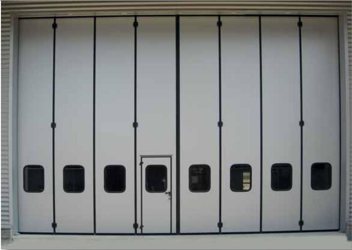
Portone a libro 4+4 - Colore Argento RAL 9006 con porta pedonale inserita senza inciampo