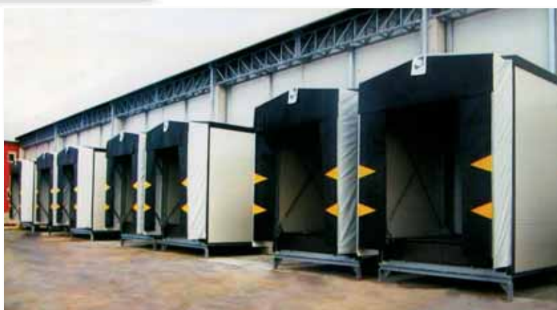
Dock - House - Con telo - Pannelli