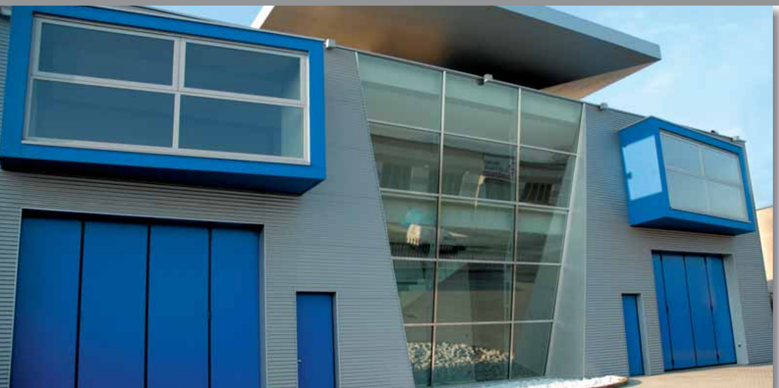
Portone a libro 2+2 - Colore Blu RAL 5010