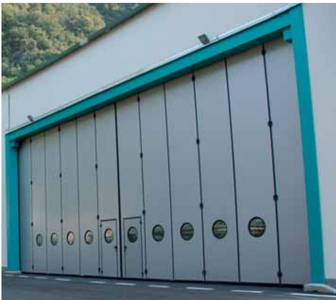
Portone a libro 6+6 - Colore Argento RAL 9006 con porte pedonali senza ingombro