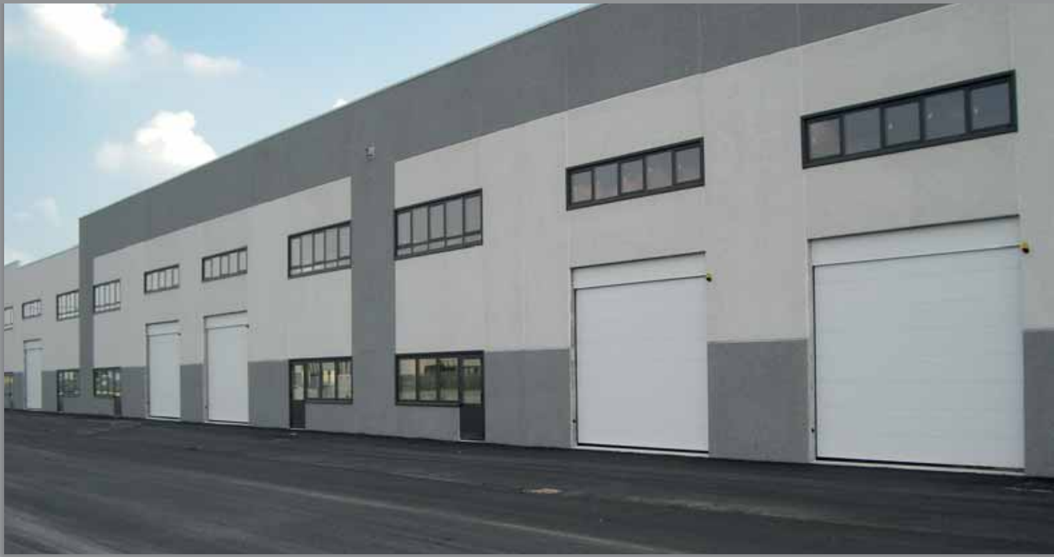
Portone sezionale RAL 9010 con veletta in pannello