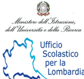
Ministero dell'Istruzione, dell'Università e della Ricerca