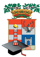
Ordine Avvocati di Cremona