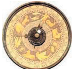
Ordine Ingegneri Provincia di Cremona