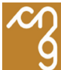
Collegio Provinciale Geometri e Geometri Laureati di Cremona