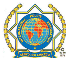
INTERNATIONAL POLICE ASSOCIATION Associazione Internazionale di Polizia Organo Consultivo dell'O.N.U. e del Consiglio d'Europa Sezione Italiana Delegazione 2° Lombardia Comitato Locale di Crema